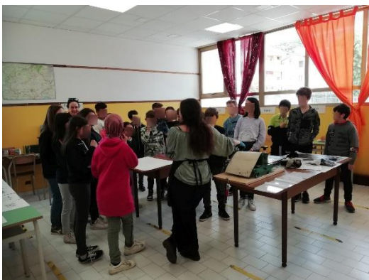
Lezione di stampa con studenti di una classe prima della scuola secondaria di primo grado