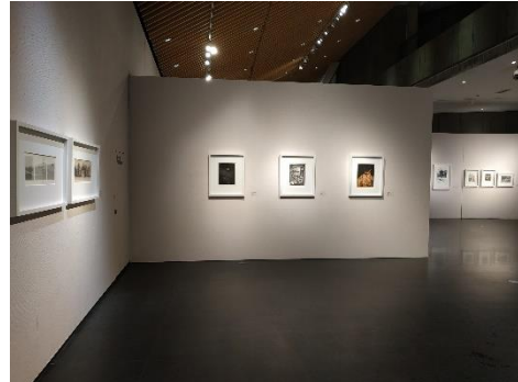
Mostra di opere dell'associazione al China Printmaking Museum, Guanlan