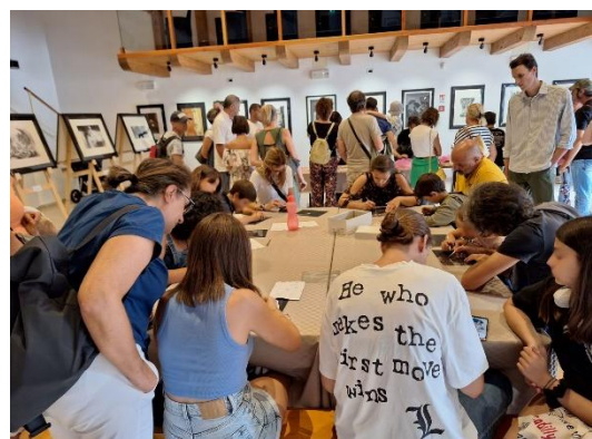
Laboratorio di incisione e stampa per i visitatori di una mostra