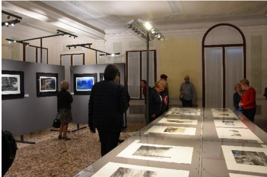
Mostra Italia-Giappone alla Fondazione Benetton di Treviso